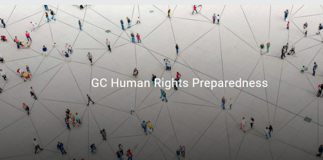
GC Human Rights Preparedness

Coordinated by the Centre for Human Rights, Faculty of Law, University of Pretoria, South Africa.